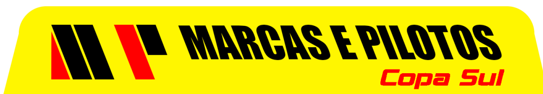
Testeira Vidro Dianteiro

– 03.7.b – Identificação da categoria LIGHT