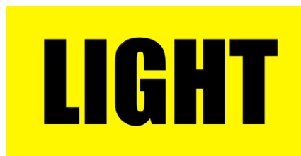
Adesivo Vidro Traseiro