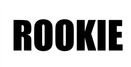
Adesivo Vidro Traseiro