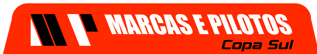
Testeira Vidro Dianteiro

– 03.7.a – Identificação da categoria SUPER