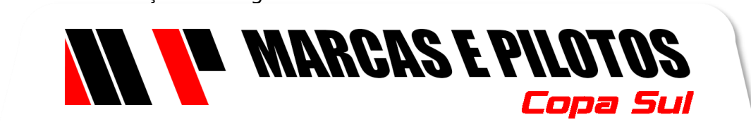
Testeira Vidro Dianteiro

– 03.7.c – Identificação da categoria ROOKIE