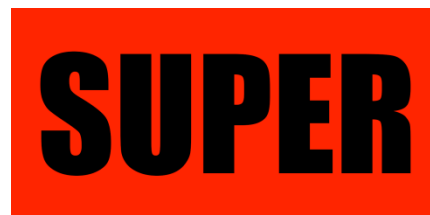
Adesivo Vidro Traseiro